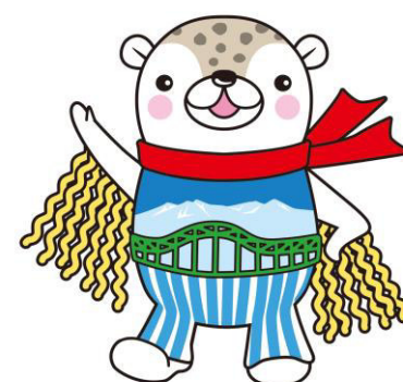
旭川市シンボルキャラクター あまびい

ぜひ、皆様の声をお聴かせください。 多くの市民の皆様のご参加をお待ちしております!!