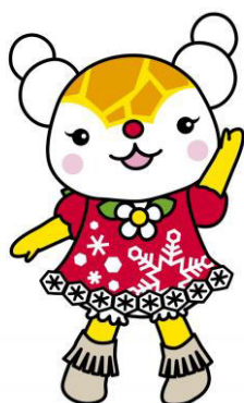
旭川市キャラクター ゆっきりん

ぜひ、皆様の声をお聴かせください。 多くの市民の皆様のご参加をお待ちしております!!