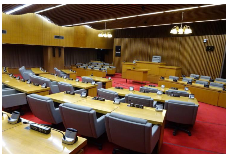
旭川市議会議場の写真