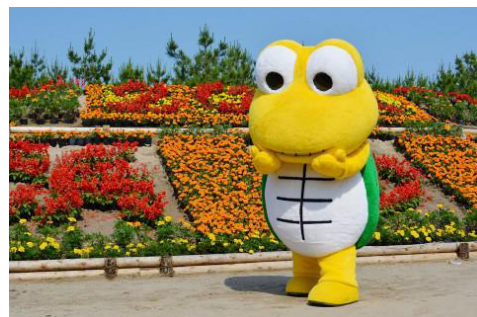
南さつま市吹上浜砂の祭典マスコットキャラクター 「サンディーくん」

旭川と九州南さつま市は「雪像」と「砂像」を通じた交流を行い、来年2月には両まつりの実行委員会が姉妹盟約を結び10周年を迎えます。これを記念し、今年の吹上浜砂の祭典のテーマとなった「サンディーくんと童話の世界」にならい、あさっぴーとサンディーくんが童話の世界に登場するデザインを募集します。