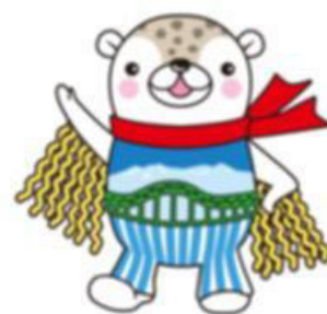
旭川市シンボルキャラクター 「あさっぴー」