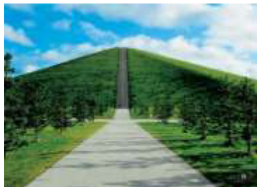
モエレ沼公園（北海道札幌市）

約 270 万トンのごみを埋め立てた跡地を総合公園として整備。山や噴水、遊具などの施設を配置し、自然とアートが融合した美しい景観が楽しまれている。