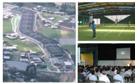
クリーンコアたかざき（宮崎県都城市）

約 110 万トンのごみを埋め立てた跡地をゴルフ場（9 ホール）として整備。管理は民間企業に委託し、利用料金収入で賄う独立採算方式を採用。売上の 1 割を市に納付している。