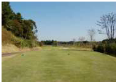
千葉市民ゴルフ場（千葉県千葉市）

約 110 万トンのごみを埋め立てた跡地をゴルフ場（9 ホール）として整備。管理は民間企業に委託し、利用料金収入で賄う独立採算方式を採用。売上の 1 割を市に納付している。（出典：公益社団法人ゴルフ緑化促進会ホームページ）