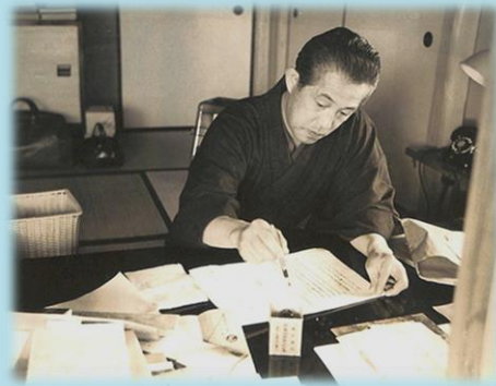
昭和 34 年 自宅書斎