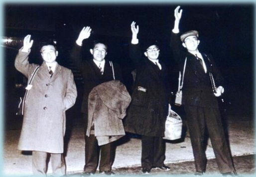
昭和 32 年初の訪中