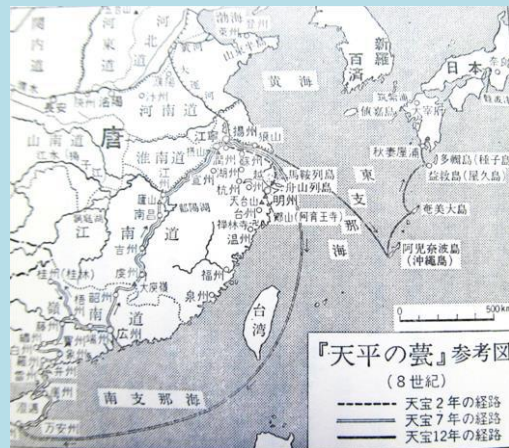
『天平の薨』参考図 (8世紀) --- 天宝2年の経路 —— 天宝7年の経路 —— 天宝12年の経路