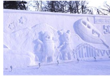
前回の作品「あつというまに、あさひかわ。」

これからも世界中の皆さんに感動を与える旭川冬まつりを市民のみなさんと共に作り上げるため、まつりのシンボルである世界最大級の大雪像を臨むバルコニー雪像の壁面を飾る素敵なデザイン案を、市民の皆さんから募集します。