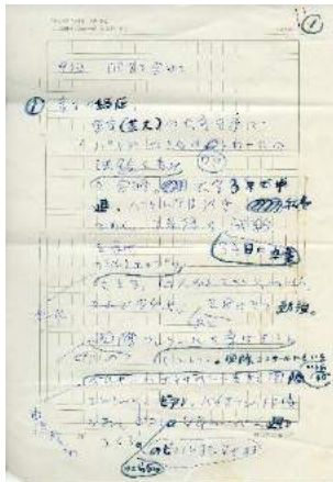
『流沙』創作メモ 神奈川近代文学館蔵