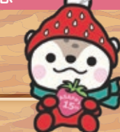
オリジナルマスコット ぬいぐるみ