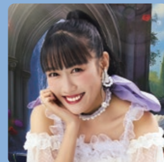
ももいろクローバーZ

とき 2/7(土) 14:00から (14:20～15:00は音響確認のため一時休止) 出演