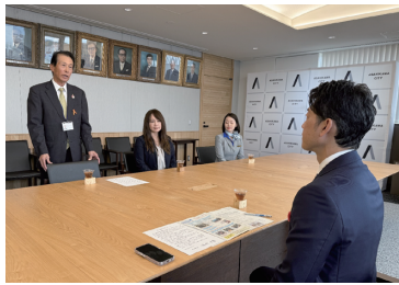
市田会長から今津市長へ募金運動への支援と協力を要請