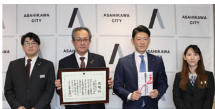
(株)田中組旭川支店 交通遺児を守る会 様 200,000円 (子ども基金)