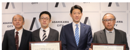
旭川地方木材協会、旭川木材青壮年協議 会 様 115,500円 (市有林ヘミズナラ、イタヤ カエデ、ヤチダモの苗木計420本植樹)