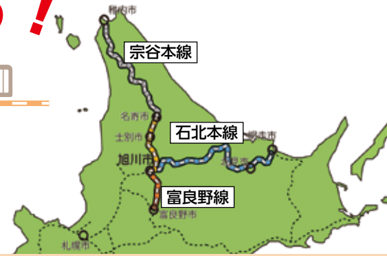
宗谷本線・石北本線・富良野線の輸送密度の推移