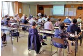
シニア・百寿大学での啓発講座

鉄道に対する関心を高めて理解を深めてもらうため、様々な活動やイベントを実施しています。また、鉄道路線の沿線市町と話し合い、連携した取組みも行っています。