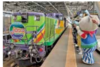
観光列車のお見送り