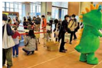
車両見学会で沿線市町と鉄道利用へのPR