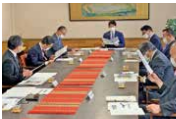
沿線の取組みを話し合う会議