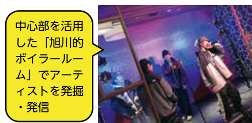
中心部を活用した「旭川のポイラールーム」でアーティストを発掘・発信