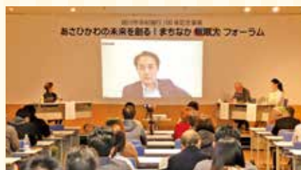
まちなか無限大∞フォーラム

旭川は教育機関が集まっているので、日常的なにぎわいに向け、若者に当事者になってもらうことが鍵。何かに取り組み、自己実現できる場をまちなかに作りたくです。そのためにACTが良い背中を見せたいです。まちなかは、歩きながら四季や歴史を感じるのにもってこの場所です。ぜひ、色んな景色を楽しんでもらいたいです。