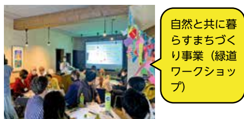
自然と共に暮らすまちづくり事業（緑道ワークショップ）

けん玉チーム「ASAHI D.A.M.A」の代表をしており、今年度、旭川駅前エリアでは「旭川をけん玉の街にする」という企画を予定しています。誰でも楽しめるけん玉が持つ可能性は無限大。けん玉で旭川を盛り上げていきたいと思っています。人が行き交い輝いていた買物公園で育ち、帰郷して活力のなさに衝撃を受けました。旭川は北海道第二の都市。その玄関口である旭川駅前には元気があつてこそ、観光の目的になり、宿泊にもつながります。私の店がある緑橋ビル商店街のように、若い人も魅力を感じる貴重な資源はまだありません。「何も無いよね」と下を向くのではなく、多くの人にアイデアを寄せてほしいです。ACTの活動を通して、魅力的な人やものを発掘し、広く伝えていきたいです。