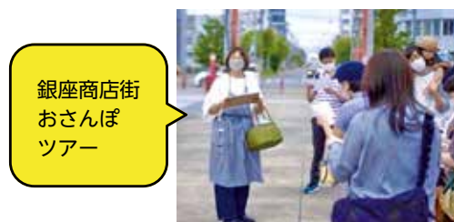
銀座商店街おさんぽツアー