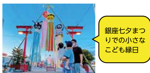
銀座七夕まつりでの小さなこども縁日

このエリアには、きれいに整えられた街路にカフェや書店、イベントスペースが集まる七条緑道があり、ACTで魅力を発信しています。私は、別のディープな空間でのライブを企画しました。アーティストの発掘と発信を通して、若い人に「旭川にもいい所があるじゃん」と思ってもらえたらうれしいです。ライブハウスのある買物公園は貴重なストリートです。この環境を生かし、見たこともないような催しを続けたいです。ありきたりな体験ばかりではカルチャーは生まれません。大切なのは、地元の人々がどれだけ楽しいことをやれるか。まちなかへ出かける目的をつくり、刺激や満足感を提供するのが私たちの役割です。新しい風を吹かせる人を見つけ、応援したいです。