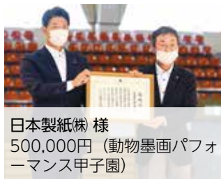
日本製紙(株) 様 500,000円(動物墨画パフォーマンス甲子園)