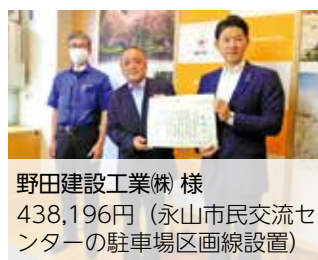
野田建設工業(株) 様 438,196円(永山市民交流センターの駐車場区画線設置)