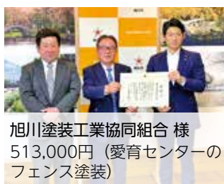
旭川塗装工業協同組合 様 513,000円(愛育センターのフェンス塗装)