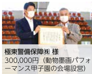
極東警備保障(株) 様 300,000円(動物墨画パフォーマンス甲子園の会場設置)