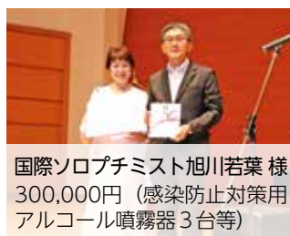
国際ソロプチミスト旭川若葉 様 300,000円(感染防止対策用アルコール噴霧器3台等)