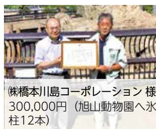
(株)橋本川島コーポレーション 様 300,000円(旭山動物園へ氷柱12本)