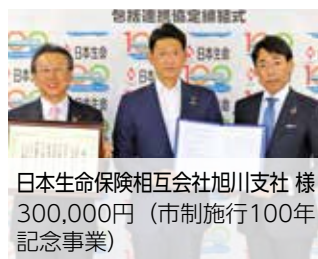
日本生命保険相互会社旭川支社 様 300,000円(市制施行100年記念事業)