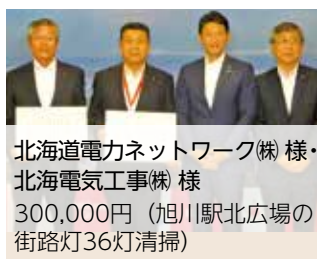
北海道電力ネットワーク(株)様・ 北海電気工事(株) 様 300,000円(旭川駅北広場の街路灯36灯清掃)