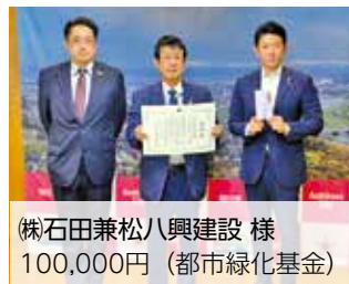
(株)石田兼松八興建設 様 100,000円(都市緑化基金)