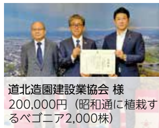
道北造園建設業協会 様 200,000円(昭和通に植栽するペゴニア2,000株)