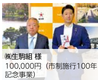
株生駒組 様 100,000円(市制施行100年記念事業)