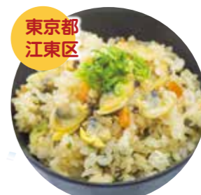
東京都江東区 深川めし