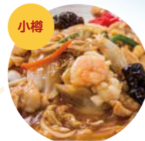
小樽 小樽あんかけ焼きそば