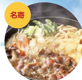
名寄 なよろ煮込みジンギスカン