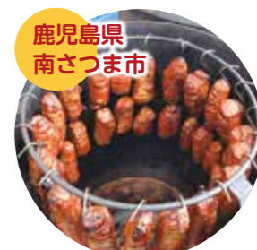
鹿児島県南さつま市 黒豚の焼豚