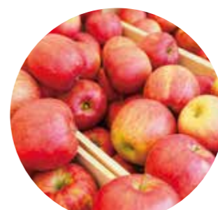
ファーマーズマルシェ