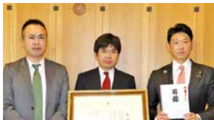
山田二郎松商店 3,000,000円 (市制施行100年記念事業)