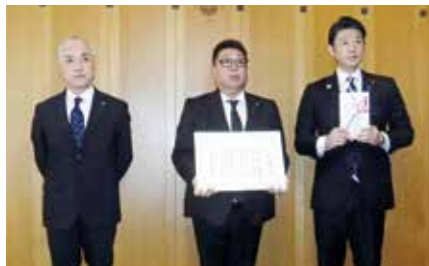
旭東清掃 1,000,000円 (環境基金)