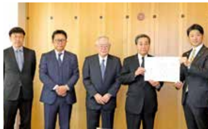
北海道民共済生活協同組合 1,000,000円 (庁舎建設整備基金)