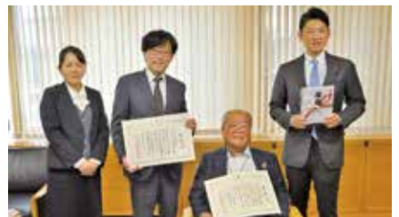
北斗ホールディングス・北斗警備 2,000,000円 (育英事業基金、市制施行100年記念事業)