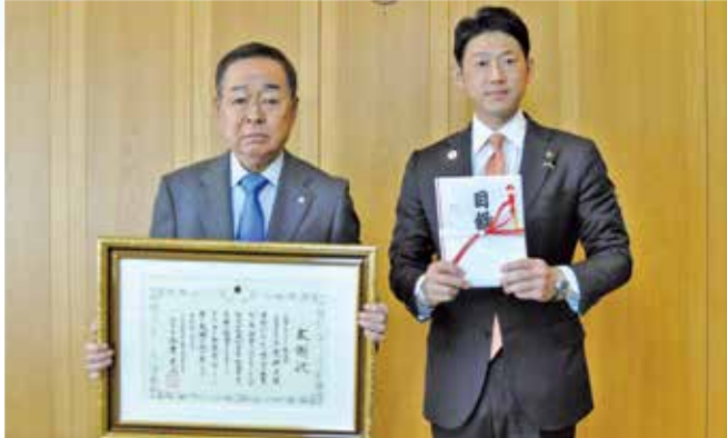
大地コンサルタント 10,000,000円 (市制施行100年記念事業)

市では、皆さんから頂いた寄附金や寄贈品を、市政発展のため様々な事業に活用させていただいております。これからも魅力ある旭川のまちづくりに努めてまいりますので、温かいご支援をお願いします。