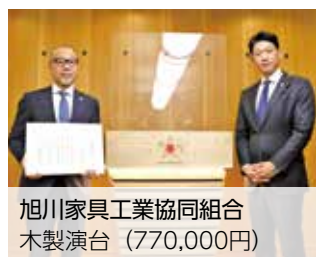
旭川家具工業協同組合 木製演台 (770,000円)