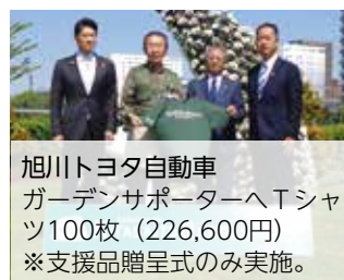
旭川トヨタ自動車 ガーデンサポーターヘッシャツ100枚 (226,600円) ※支援品贈呈式のみ実施。