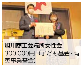
旭川商工会議所女性会 300,000円 (子ども基金・育英事業基金)