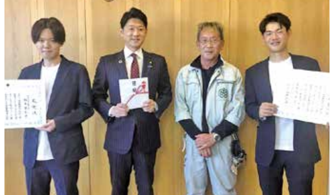
旭山動物園応援プロジェクト 7,234,062円 (旭山動物園)