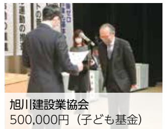
旭川建設業協会 500,000円 (子ども基金)