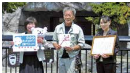
生活協同組合コープさっぽろ 2,000,000円 (あさひやま“もっと夢”基金)