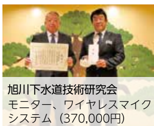
旭川下水道技術研究会 モニター、ワイヤレスマイク システム (370,000円)