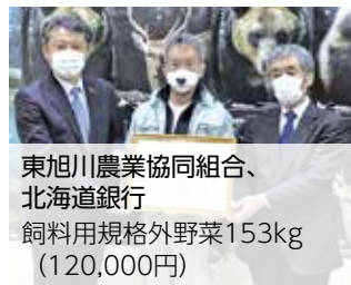
東旭川農業協同組合、 北海道銀行 飼料用規格外野菜153kg (120,000円)