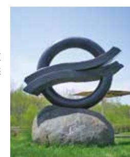
平成16年制作・御影石製・ 高さ120cm・忠別橋公園に設置

風紋とは、風によって砂地な どにできる模様のこと。設置 されているのは忠別川の河畔 で、爽やかな風が感じられる