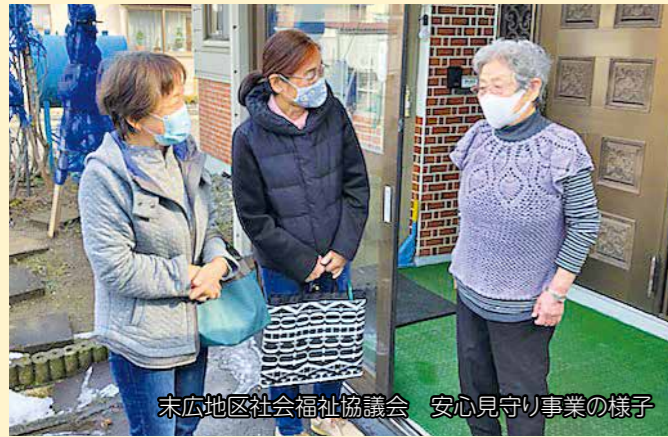
末広地区社会福祉協議会 安心見守り事業の様子

病気や障がい・高齢等で、日常生活に不安を抱えている方などを隣近所の住民同士で見守る活動です。活動を通して、不安や孤立感を解消し、互いに安心して暮らすことができる地域を築くことを目的としています。マスク着用など、感染予防対策を実施しながら活動を続けています。