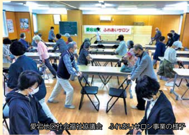
愛宕地区社会福祉協議会 ふれあいサロン事業の様子