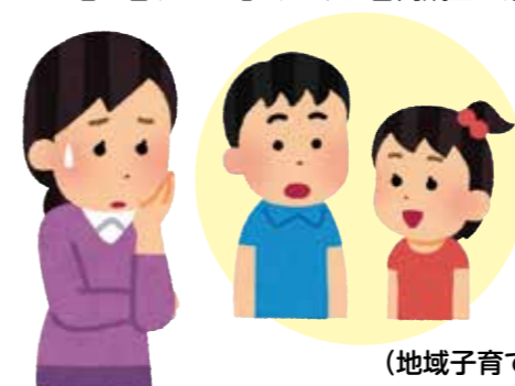
（地域子育て支援センターおひさま より）

口呼吸の原因が鼻詰まりである場合は、症状の改善に努めましょう。無意識に開けてしまう場合は「にらめっこ」などの口を使った遊びを通して、口を結ぶ動作が習慣となるようにしましょう。