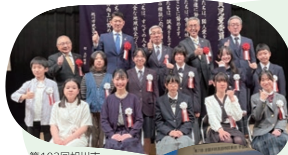
第103回旭川市 民生委員児童委員 連絡協議会大会