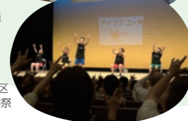
第7回全国 手話言語市区 長会 手話劇祭