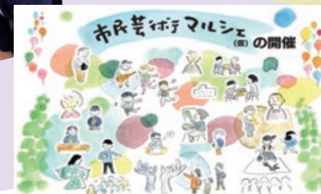
旭川未来会議2030 (文化分野)からの ご提案資料より抜粋