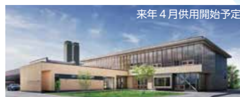
来年4月供用開始予定