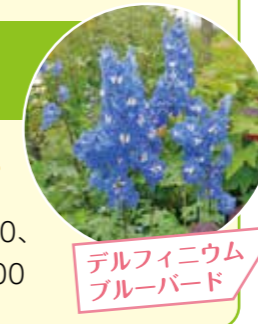
デルフィニウムブルーバード

ベストシーズンの花壇をガーデナーが案内します。 とき 6/10(水) 13:00~14:00、 6/11(木)~14(日) 10:00~11:00