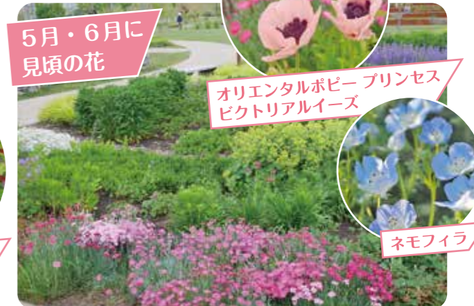
オリエンタルポピー プリンセス ビクトリアルイーズ