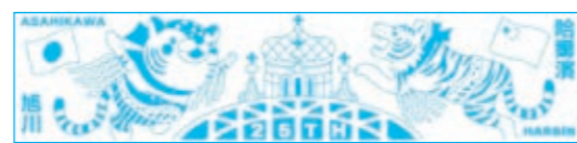
中国・ハルビン市との友好都市提携25周年を記念したバルコニー雪像