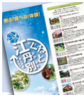
地域の見どころなどを紹介したパンフレット

地域の魅力を広く知ってもらうため、江丹別まちづくり実行委員会が中心となり、パンフレット「ぐるっと江丹別 別魅力満載マップ」や、景観写真を使った6種類の絵はがきを作成。さらに、全国に江丹別を発信しようとして、「江丹別（そぼと）チーズのえたんべつ」と題したホームページを開いています。