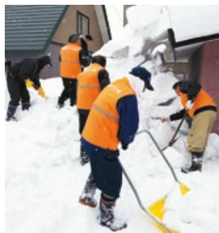
除雪作業のお手伝い

住民から意見を集めてきました。これらを踏まえ、今年度は、住民が互いに支え合う体制づくりを具体的に検討し、まずはモデル事業をスタートさせました。新旭川地区のモデル町内会では、独自の支援体制を構築し、同じ地区の高齢者宅の除雪作業のお手伝いを行っています。 今後は、除雪以外のサービスや、地域内での活動がさらに広がっていくよう、検討していきます。