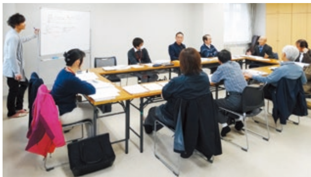
取組み内容について意見を出し合う住民たち

地域ではこれまで、「まちづくりフォーラム」を開催し、主に高齢者等の困りごとについて