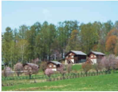
宿泊研修などに利用できる「江丹別 若者の郷」

江丹別は、冬の積雪が2m以上となる一方で、夏には30℃まで気温が上がるなど、季節がはっきりしているのが特徴です。明治の開拓期から第三世代へと時代が移り、過疎化・高齢化が進む中でも、若者たちによる新たな活力が育ってきています。