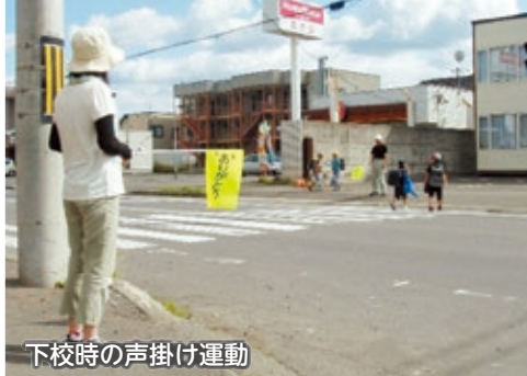
下校時の声掛け運動