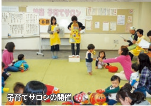
子育てサロンの開催