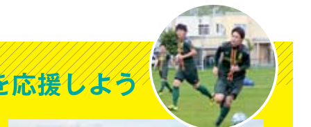
ヴェルデラッソ旭川☎を チェック！……………

9月2日(日)に東光スポーツ公園球技場、16日(日)に忠和公園多目的広場で行われる北海道サッカーリーグに出場します。ぜひ応援を！ 【詳細】スポーツ課☎23・1944