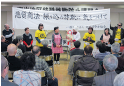
寸劇などで特殊詐欺防止を学ぶ

振り込め詐欺などの特殊詐欺の巧妙な手口を知り、被害をなくそうと、2月に特殊詐欺防止講習会を開催しました。多くの地域住民が参加した講習会では、講話や寸劇、市内で発生した詐欺事例の報告を通して、みんなに注意を呼び掛けました。参加者からは「色々な手口があることを知り、とても役に立った」と好評でした。