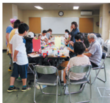
子ども朝活事業での工作づくり

また、集団生活をしながら通学をする2泊3日の「通学合宿事業」や、夏・冬休み中に生活習慣が乱れないよう学習や体験の場を提供する「子ども朝活事業」など、地域全体で子供を支える取り組みも進めています。