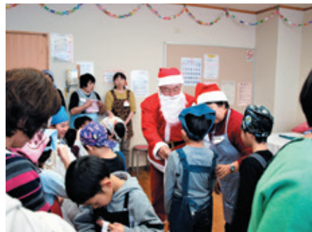
12月に開催したクリスマスパーティ

また、子供たちの豊かな心を育むため、地域の大人との料理や食事等を通して交流する「子ども食堂・楽 ら つこ こ ル ー ム」を月1回開催している他、ごみの減量と再使用の促進に向けた、生ごみの堆肥化や不用品の受渡しの開催など、子供の健全な育成やエコな環境づくりにも取り組んでいます。