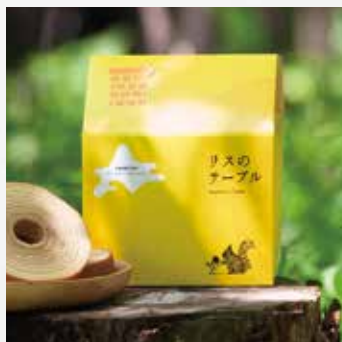
リスのテーブル (壺屋総本店) デザイン=20パーセント