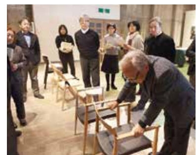
①試作された家具を審査員が厳正に審査