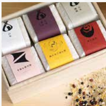
きゅーと米 (上森米穀店) デザイン=カギカッコ