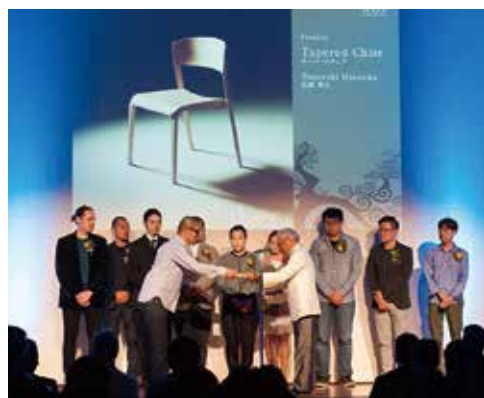
①国際家具デザインコンペティション表彰式