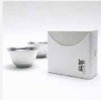
すず 錫製酒器 (アルプロ) デザイン=20パーセント