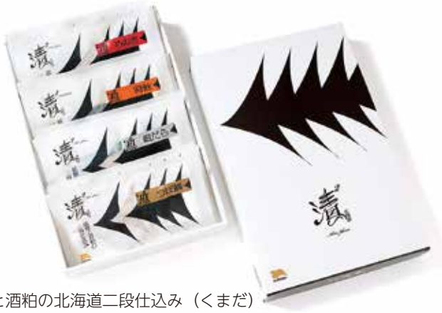
塩麴と酒粕の北海道二段仕込み（くまだ）