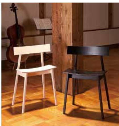
第8回・2011年 ゴールドリーフ賞