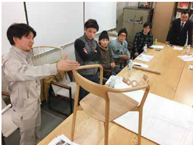
各メーカーが、試作品完成に向けて意見を出し合う

IFDAの中心的な事業である国際家具デザインコンペティションは、世界の家具デザイナーの登竜門であるとともに、旭川家具の製作技術の向上にも大きく寄与してきました。