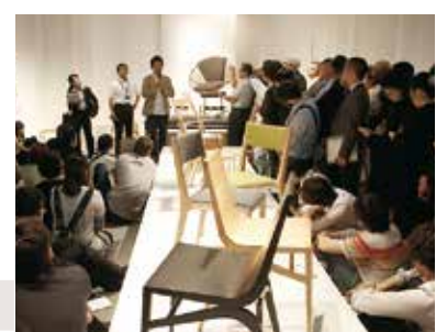
①デザイナーが作品について語るプレゼンテーション