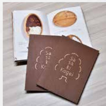
製品カタログ (ササキ工芸) デザイン=カギカッコ

旭川家具のデザイン性を高め、家具産地として旭川地域を世界に発信しているIFDAは、旭川にデザインという意識を根付かせる役割を果たしています。 そして、旭川の豊かな自然と高い技術が生み出す地場産品。地元デザイナーは、旭川のまちの魅力や生産者の思いをデザインで表現し、旭川の地場産品の魅力を高めています。 市では、これからも地場産品を全国や世界に発信する取組みを応援し、また、地場産品や旭川の魅力を広げていきます。 【詳細】工芸センター 66・1770、産業振興課 65・7047