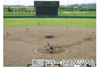
旭川ドリームスタジアム