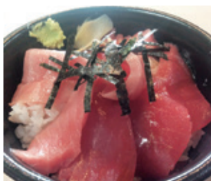
①豪快のつけ丼(イメージ)