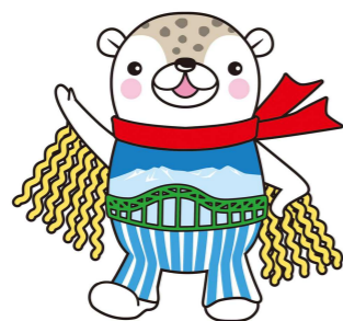
旭川市 シンボルキャラクター あさっぴー