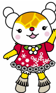
旭川市 キャラクター ゆっきりん