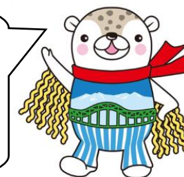
旭川市シンボルキャラクター おまひび