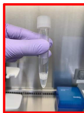
泡が多い 十分量採取されていない