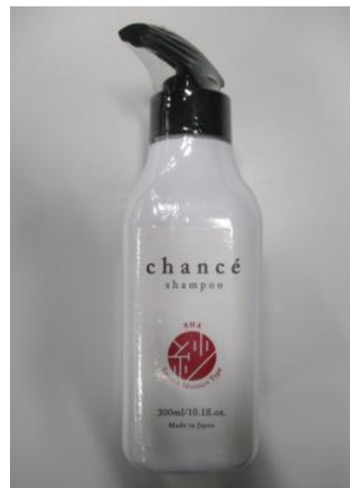
(13) シャンセ シャンプー 紗