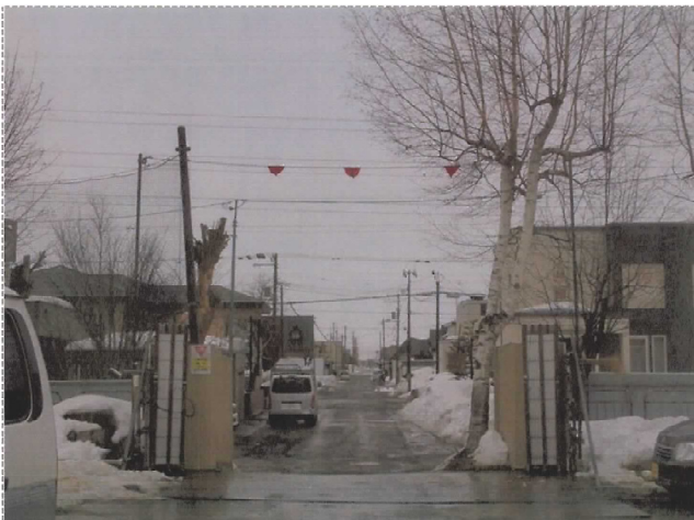
事故後の現場対応