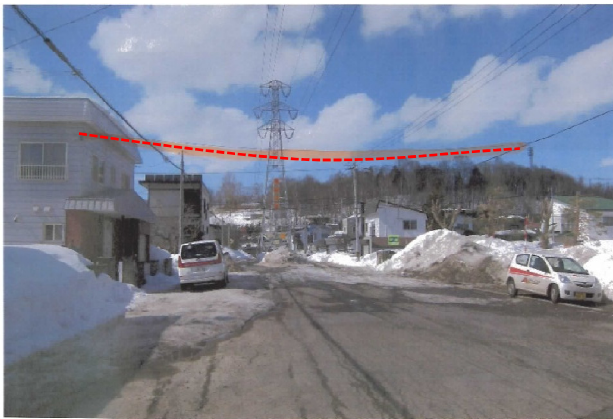
接触したケーブル②(ポテト)