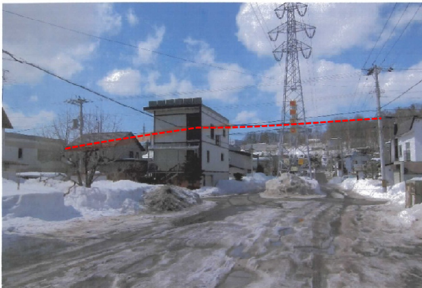
接触したケーブル③(NTT)