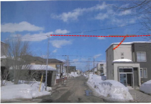
接触したケーブル①(NTT)