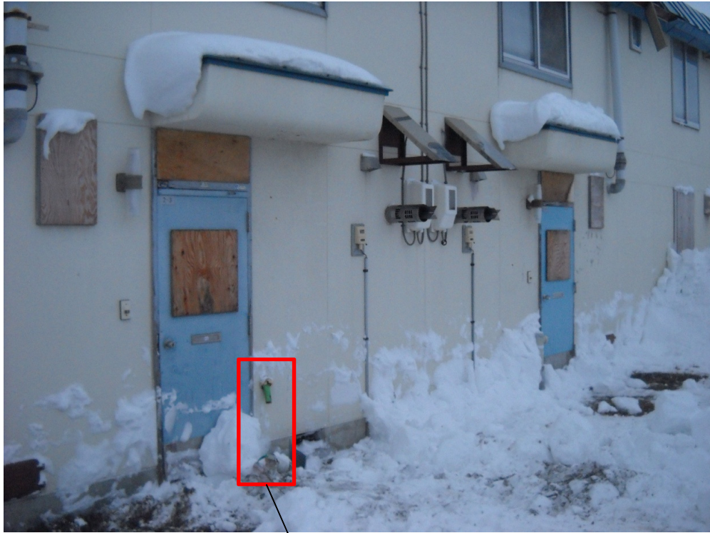
接触により破損したガス管