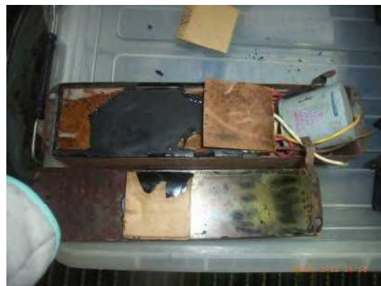
スリット付きケースの場合