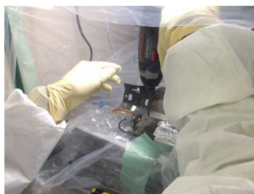
コンデンサ外付け型廃安定器充填材の採取