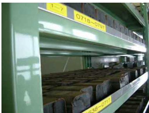
切断された廃安定器の保管例 (1)