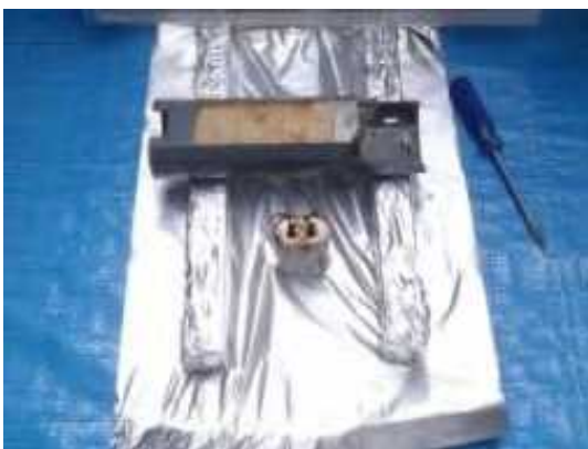
コンデンサ取り外し作業終了