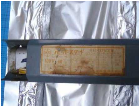
コンデンサ外付け型安定器