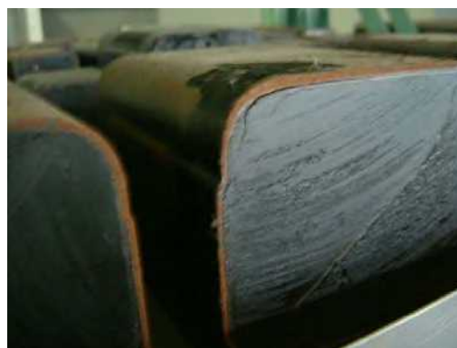
廃安定器の切断面