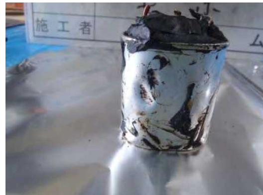
変形した剥き身コンデンサ（２）