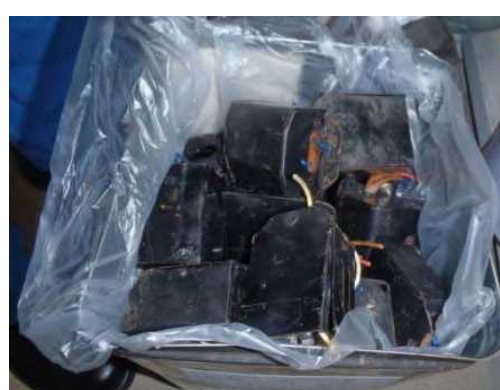
切断された廃安定器の保管例 (3)