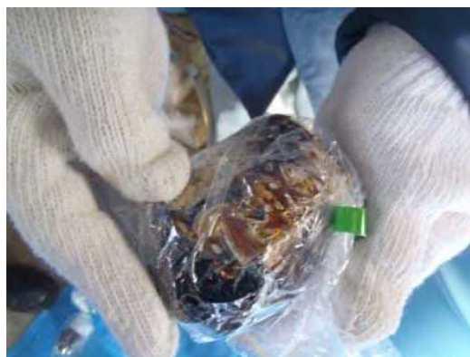
油状の液体が多量に付着した剥き身コンデンサ