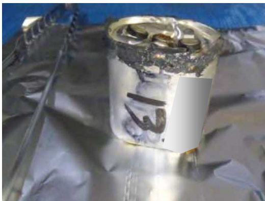
補修した剥き身コンデンサ（１）