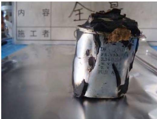
変形した剥き身コンデンサ（１）

充填材を剥いて取り出したコンデンサには、変形している事例、破損・漏洩等を 目止め材で補修した事例や油状の液体が多量に付着している事例が散見される。