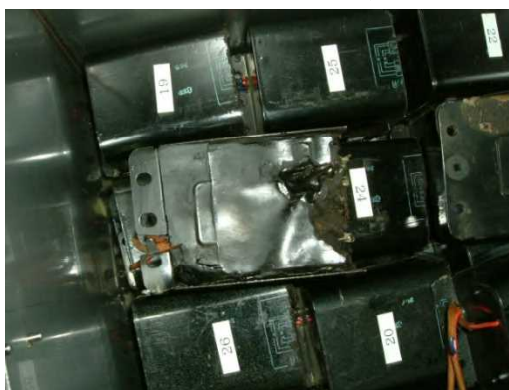
切断された廃安定器の保管例 (2)