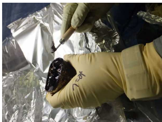
剥き身コンデンサ付着充填材の採取