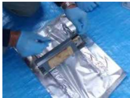
コンデンサ取り外し作業中