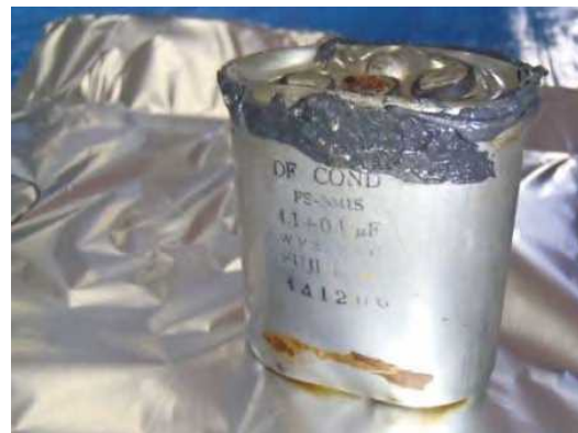
補修した剥き身コンデンサ（２）