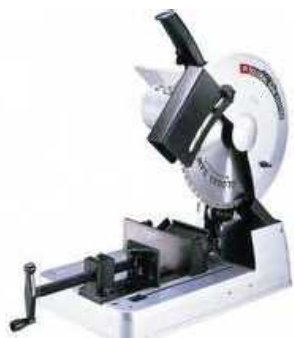
ディスクソーの例

コンデンサ充填材固定型安定器のコンデンサを含む部位と鉄心・コイルを含む部位の間をディスクソー、バンドソー等により切断し、コンデンサを含む部位のみを保管している場合がある。