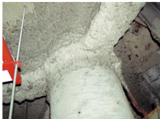
柱や梁に施工 吹付け石綿