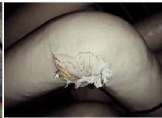
エルボ部に使用 石綿含有保温材