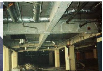
鉄骨を被覆して保護 石綿含有耐火被覆材