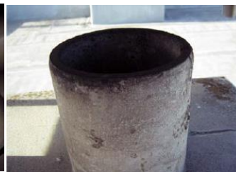
煙突の内側に使用 石綿含有断熱材