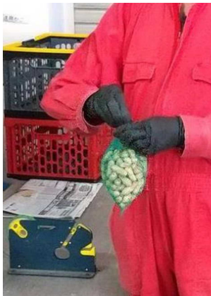
ネット袋の口をパックシーラーで閉じる