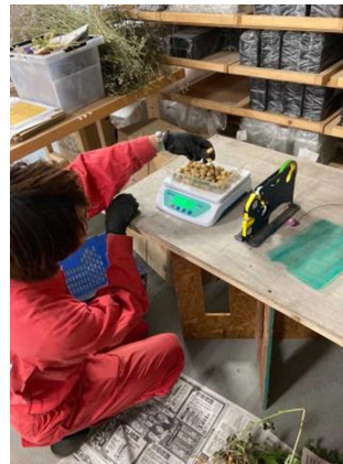
取り外したふさを計量する