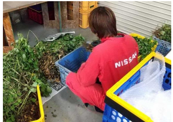
落花生の株を並べ、作業開始（このときは全工程を1名で実施）