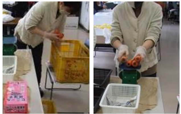
コンテナからニンジンを取り出し, 計量