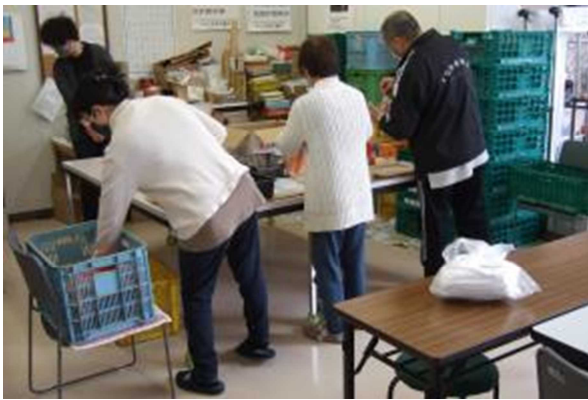
計量, 袋入れ, 袋とじをを分担して行う