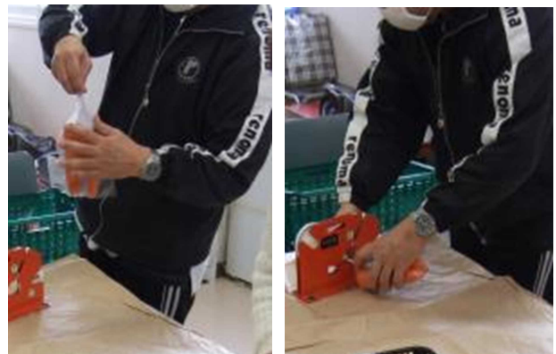
袋の口をねじり, パックシーラーでとじる