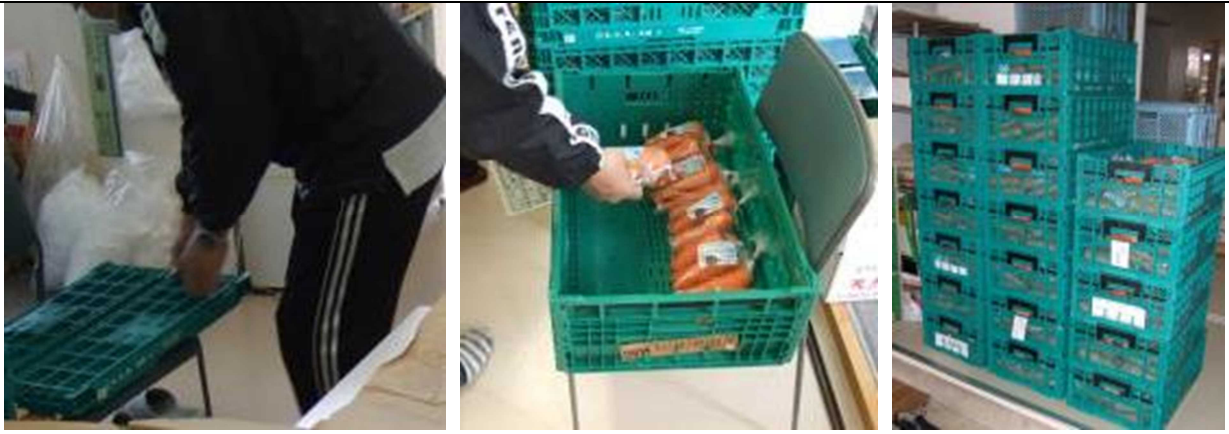
包装したニンジン、通函に向きをそろえて入れる