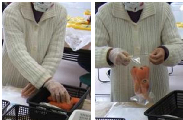
計量済みニンジン袋に入れる