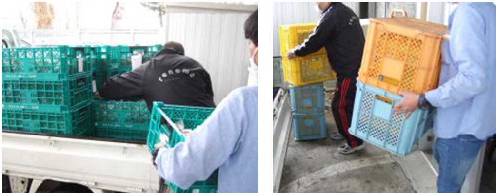
納受品時は生産者と利用者で協力して積み卸し・積み込み等を行う