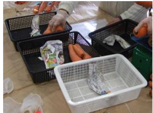
計量後, トレイに入れる（1トレイに2組まで）