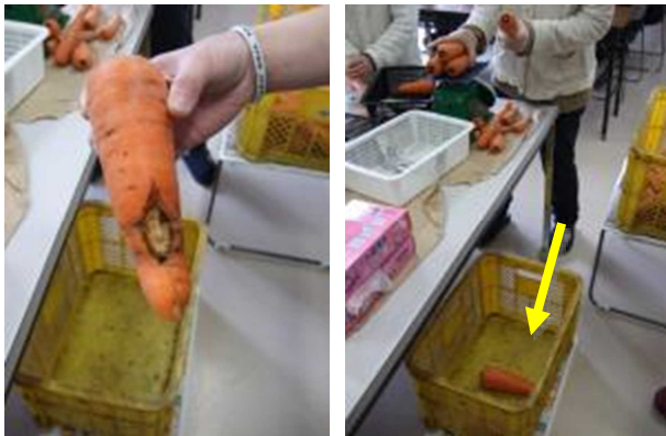
計量時に規格外品を取り除く