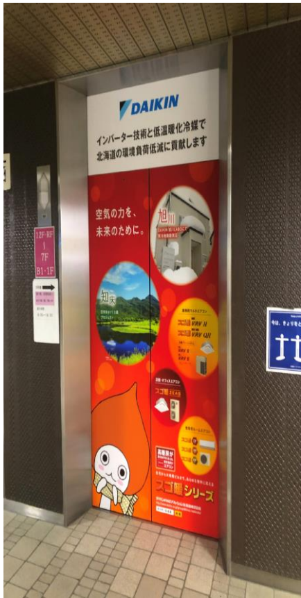
北海道庁エレベータ広告