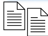
分析結果 (日英1枚ずつ)