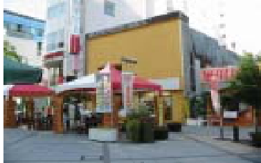
旭川屋候補地（空店舗）