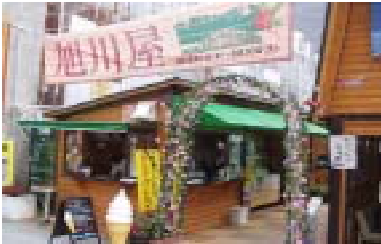
昨年の旭川屋前景