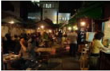
夜の様子（ピアガーデン）