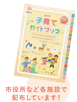
市役所など各施設で配布しています!

妊娠期から出産、子育てに関する様々な支援や子育て施設などの情報を掲載したガイドブックを発行しています。旭川での子育てを応援するための情報満載です。「waka・ba」や支所、児童センターなどの施設で配布しているほか、ホームページでもご覧いただけます。