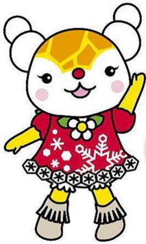
旭川市キャラクター

運転免許を取得をするための費用として補助金を交付しています。 令和6年4月9日から、先着順で交付申請を受け付けます。