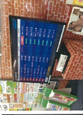
コープさっぽろ (4条通り店)