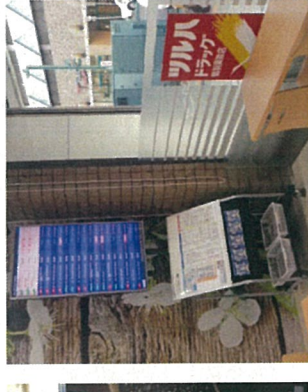
ツルハドラッグ (旭川買物公園通店)