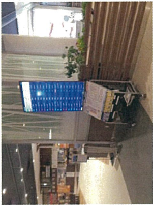
イオンモール旭川駅前