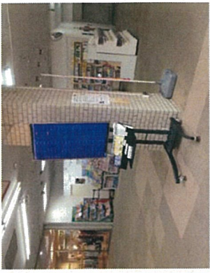
アモールショッピングセンター