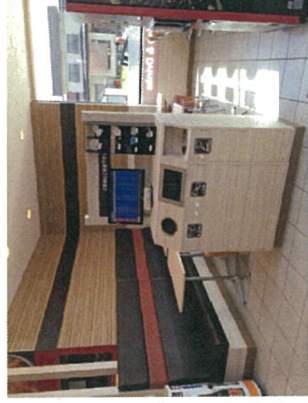
セイコーマート (神居6条店)