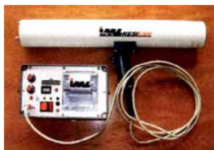
写真8 レジストグラフ

「レジストグラフ」は電動式の錐で、針が材に潜行していく際の物理的な抵抗値を記録するものです。健全な材は緻密で硬いため抵抗値が高く、腐朽した材は軟らかくなっているため抵抗値が低くなります。針が潜行していくことに伴うこの抵抗値の変化をグラフから読み取ることで、樹幹の内部状況を推測できます。