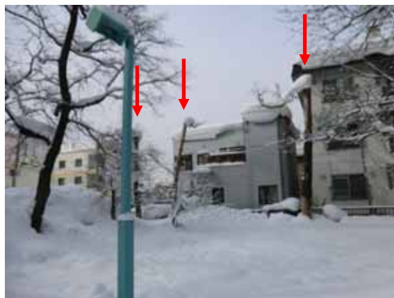
写真 1 - 1