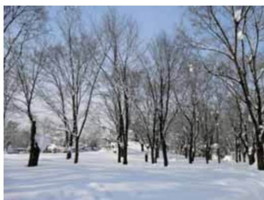
写真 5 - 1