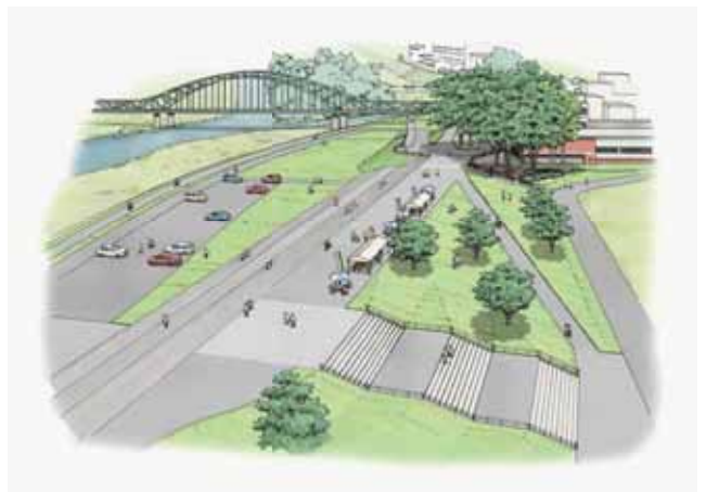
擁壁等による樹木の残置 (主にドロノキ、サクラ)