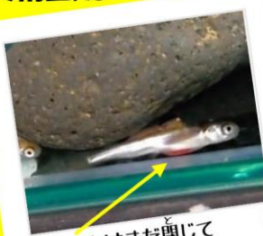
おなかはまだ閉じていません。