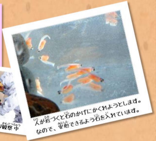
人が近づくと石のかけにかくれようとしてるので、安心できるような石を入れています。