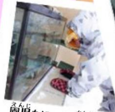
園児もじっくり観察中