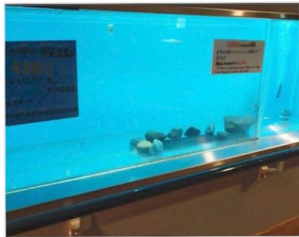
水槽の中が空っぽに見えます。

網の下にもぐっていました。まだ泳げないので、身を守るためには、かくれるしかないのです。