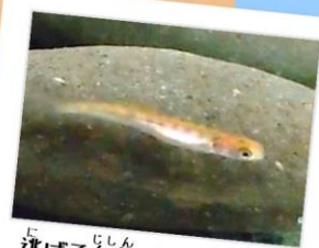
逃げる自信がついたのか、人が近づいてもあわてません。