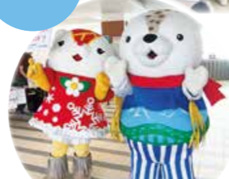
あさっぴーとゆきりんも登場!

健康まつりでは延べ300名、旭川医大祭では延べ523名の多くのみなさまに水道水と市販のミネラルウォーターを飲みくらべていただきました。結果、健康まつりでは約50%、旭川医大祭では約47%の方が、「水道水がおいしい」又は、「どちらの水もおいしさは変わらない」とお答えになっております。