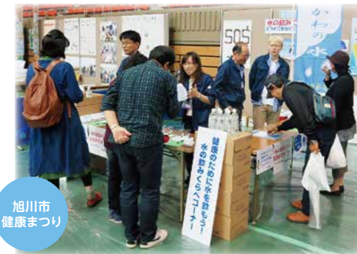
旭川市健康まつり

「旭川市健康まつり」では旭川市保健所との連携・協力のもと、「旭川医大祭」では大学祭実行委員会のご協力のもと、これからの暑くなる季節にあわせて「安心・安全」、「経済的」、「お手軽」の三拍子そろった水道水のおいしさをPRしました。