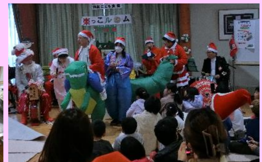
12月はクリスマス会 サンタの登場でみんな大喜び！