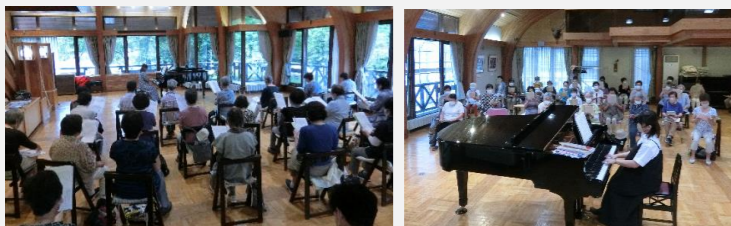
みんなで歌って健康に！ 生ピアノで歌いましょう！