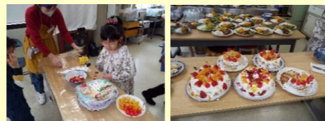
みんなでXmasケーキづくり