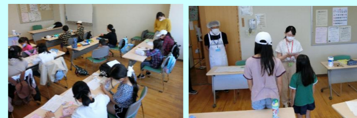
旭川医大生が教えてくれます 出席回数が10回ごとに表彰