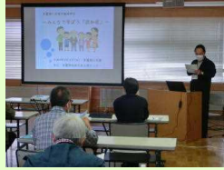
認知症をみんなで考えよう 6月16日(木)