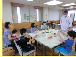
夏休み子ども科学教室 8月8日(月)