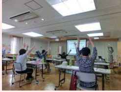
女性のための「健康づくり栄養講座」 5月12日(木)、26日(木)