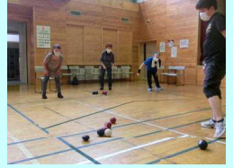
ポッチャ体験会 7月23日(土)・8月27日(土)